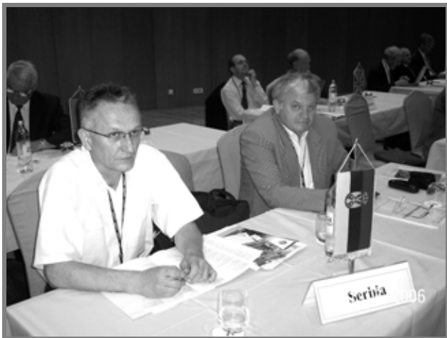
Predstavnici iz Srbije na sednici generalne Skupštine IIW

Godišnju skupštinu Međunarodnog instituta za zavarivanje je pratilo oko 600 učesnika iz 49 zemalja u svojstvu delegata, eksperata ili posmatrača u tehničkim komisijama, članova radnih grupa ili drugih tela IIW i IIW konferencije.